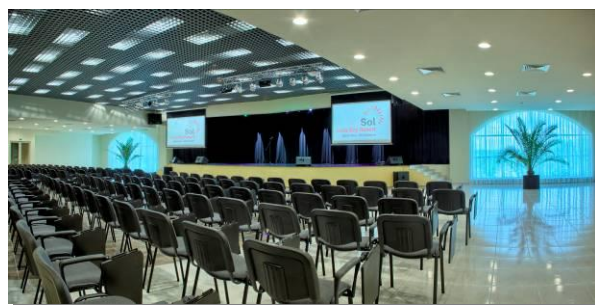
Зала София, 350 участника

Комплексът разполага с четири конферентни зали- една с капацитет 350 участника, две с капацитет 50 участника и една – 80 участника. Снабдени са с техническо оборудване и могат да бъдат подходящо място за Вашата среща или друг вид бизнес събитие.